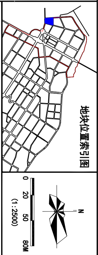
地块控制指标一览表